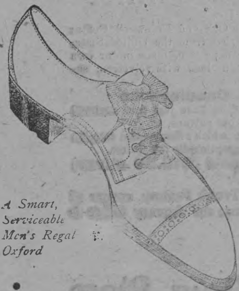
A Smart, Serviceable Men's Regal Oxford

Regals are just as much better in fit and wear as they are in looks. You never have to "break in" a pair of Regals—and they hold their smart custom shape throughout long, satisfactory service. Regals are made of the finest leathers in the world. It's real economy to wear them. We want you to come and see these Regals, and try them on at any time.