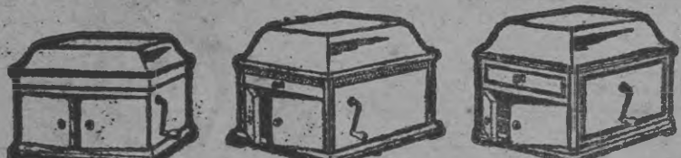
Victor-Victrola IX, $50. Victor-Victrola X, $75. Victor-Victrola XI, $100.

"LA POSTAL." FRONTING SANTA ANA PLAZA, PANAMA.