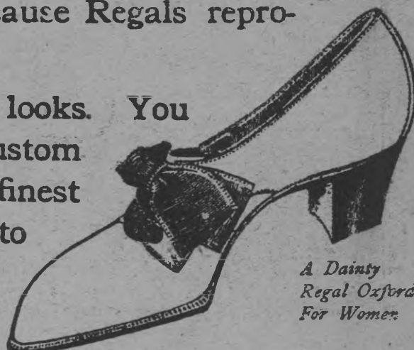
A Dainty Regal Oxford For Women